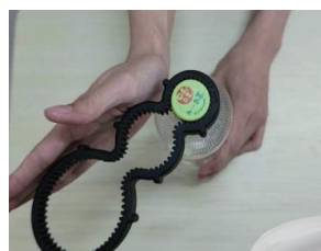
① キャップ オープナー